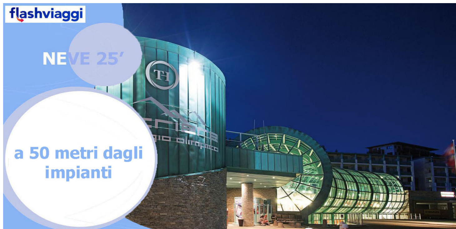
TH Sestriere HOTEL - mezza pensione, bevande ai pasti escluse