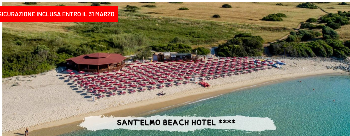
SANT'ELMO BEACH HOTEL ****