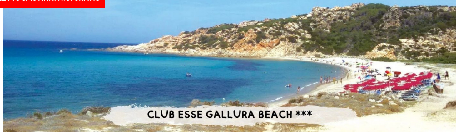
CLUB ESSE GALLURA BEACH ***