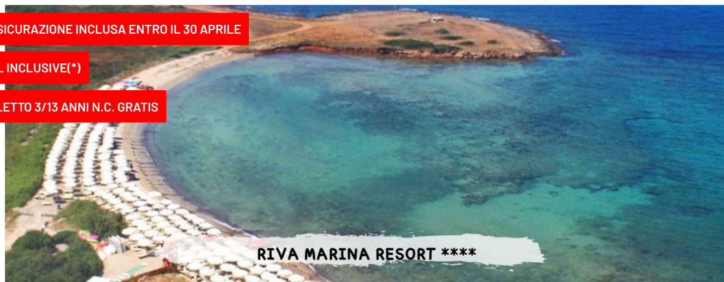
RIVA MARINA RESORT ****