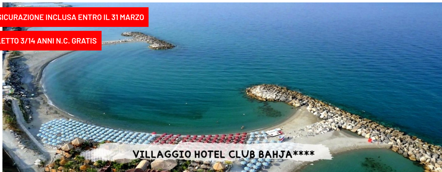
VILLAGGIO HOTEL CLUB BAHJA****