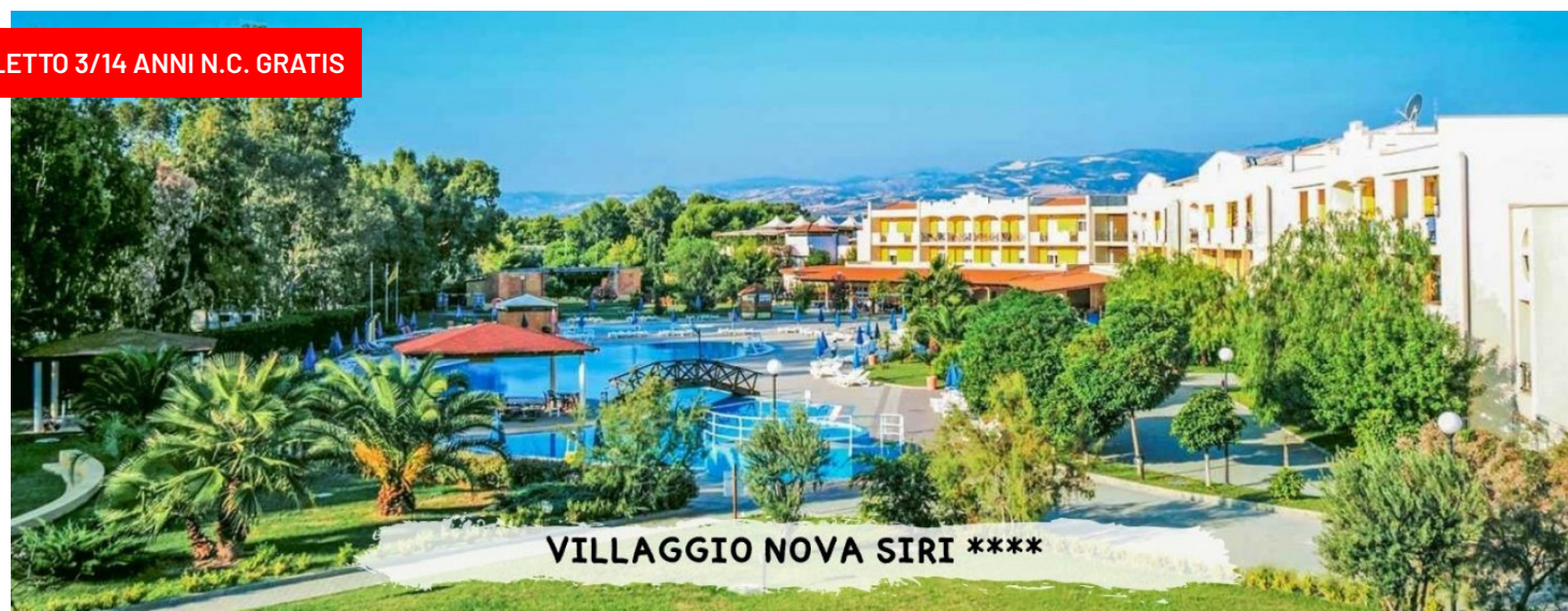
VILLAGGIO NOVA SIRI ****