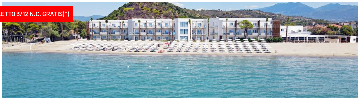
Quote settimanali per persona in camera Comfort Vista Parco in Pensione Completa