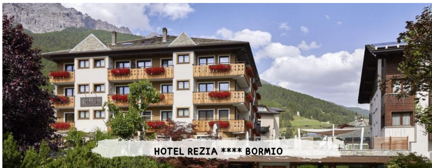
HOTEL REZIA **** BORMIO